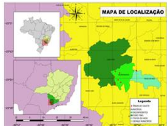
Figura 1: Pontos de coleta da odonofauna em diferentes áreas nos municípios de Inconfidentes, Ouro Fino e Tocos do Moji, estado de Minas Gerais.

Bedê e Machado (2002). As coletas ocorreram por meio de caminhadas próximas aos cursos hídricos, tanto lênticos como lóticos, para a captura dos espécimes.