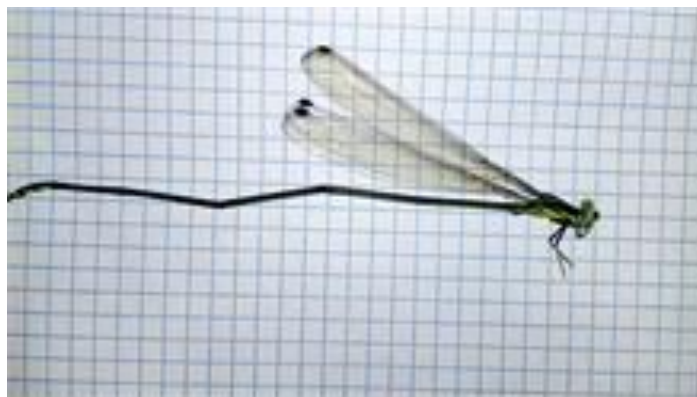
Figura 4: Espécie de Mecistogaster mielkei encontrada no município de Inconfidentes, sul do estado de Minas Gerais.