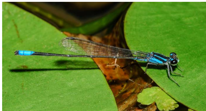
Figura 3: Espécie Acanthagrion gracile , na área de estudo.