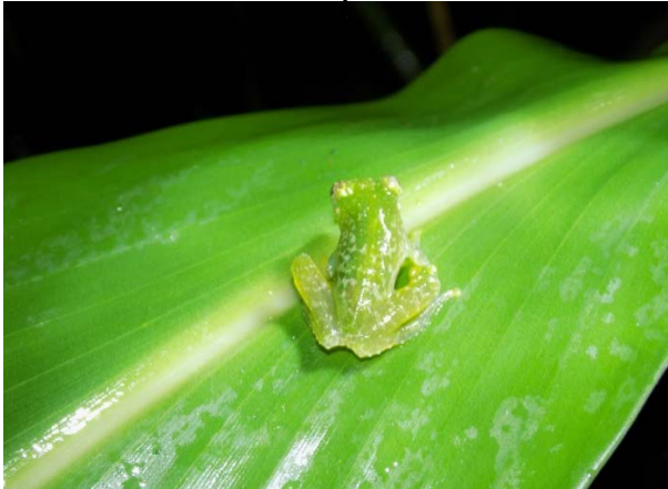
Figura 6: Vitreorana uranoscopa encontrada no município de Ouro Fino.