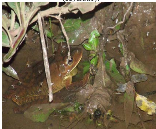
Figura 4. Foto da Hypsiboas faber (Hylidae).