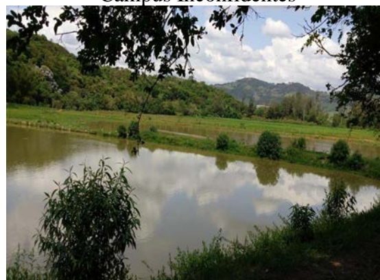
Figura 3: Represas artificiais localizadas na Fazenda escola do IFSULDEMINAS – Campus Inconfidentes