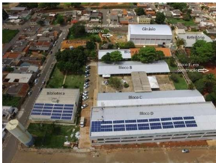
Figura 05 – Vista aérea do Campus Passos