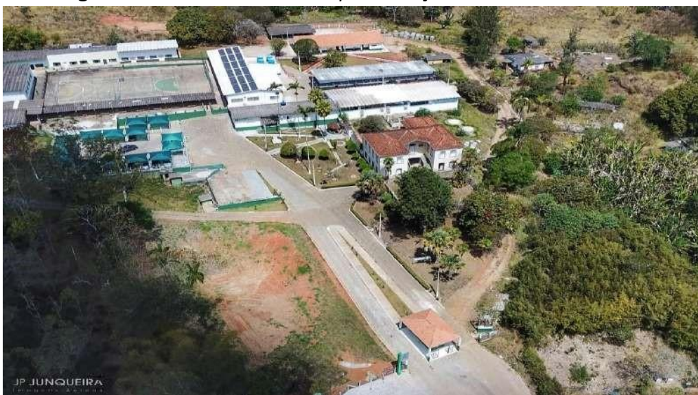
Figura 09 – Vista aérea do Campus Avançado Carmo de Minas