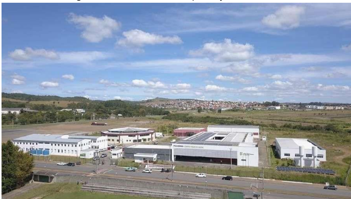
Figura 06 – Vista aérea do Campus Poços de Caldas