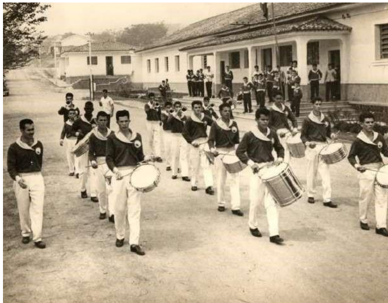
Figura 04 – Desfile da Banda de Música dos Alunos da Escola Agrícola de Machado