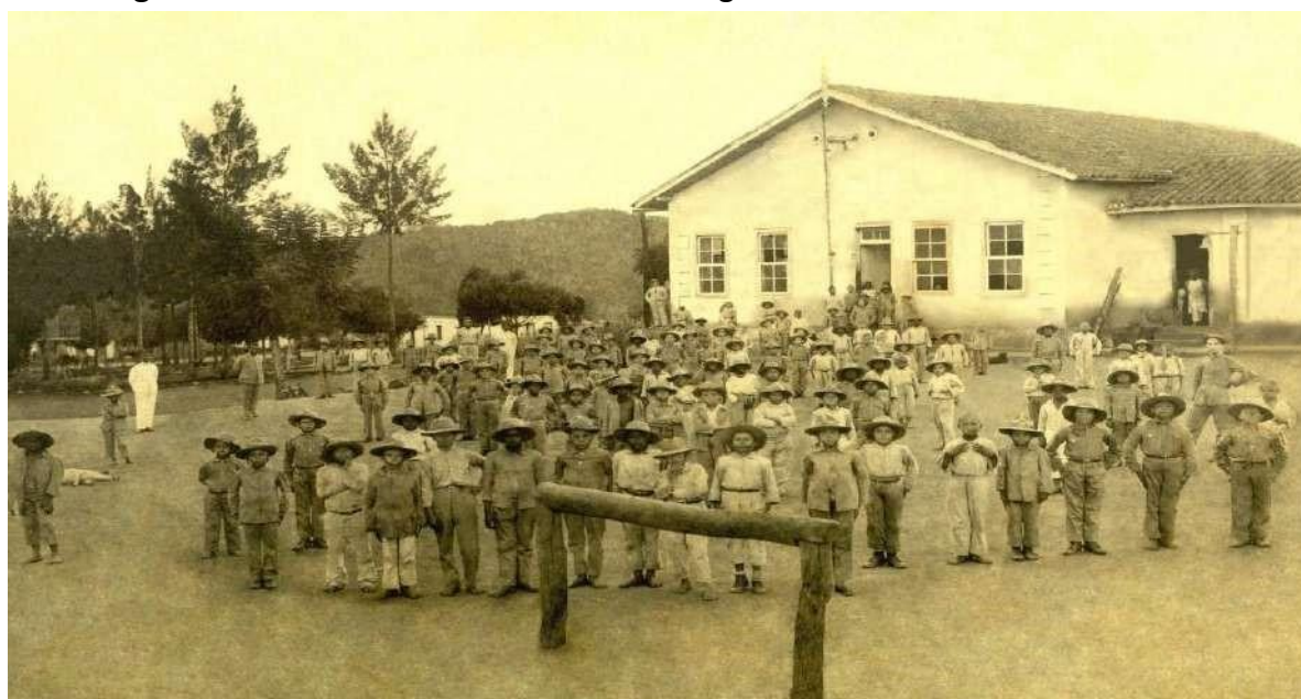
Figura 02 – Primeira turma do Patronato Agrícola de Inconfidentes - 1918