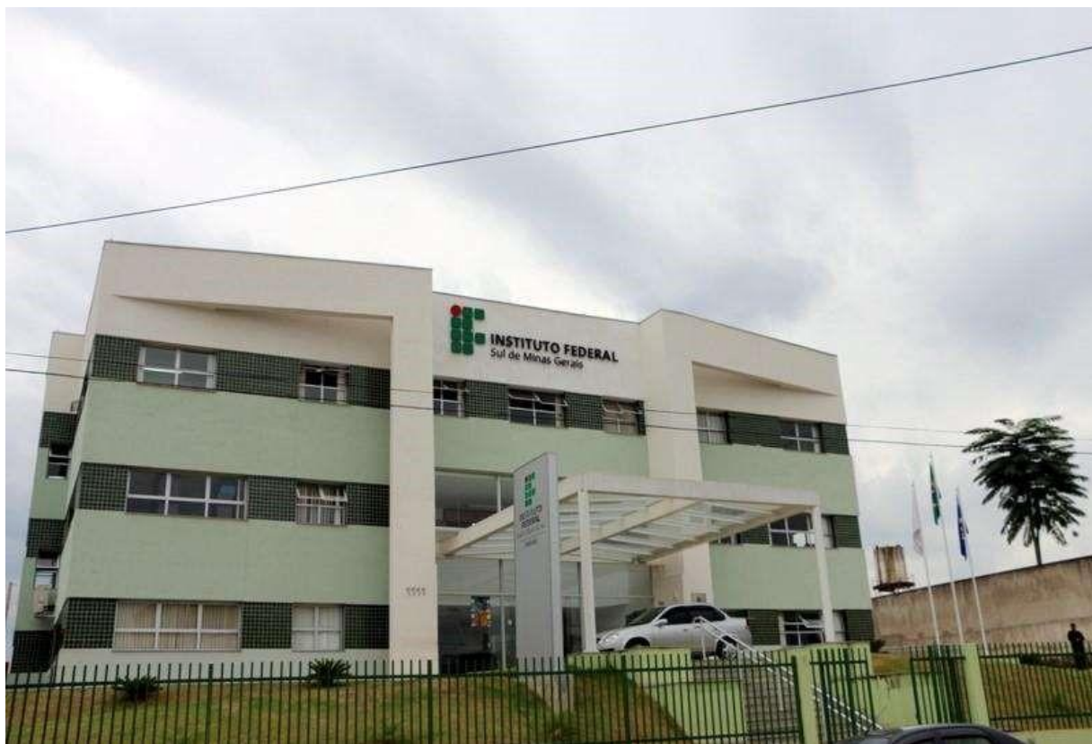
Figura 10 – Fachada do prédio principal da Reitoria do IFSULDEMINAS

bairro Medicina, de Pouso Alegre, onde a Reitoria passou a funcionar. Com o aumento das demandas e a expansão do IFSULDEMINAS, em 2012, um prédio anexo ao antigo endereço se juntou à estrutura, abrigando setores como Diretoria de Tecnologia da Informação, Diretoria de Ingresso e a Pró Reitoria de Desenvolvimento Institucional.