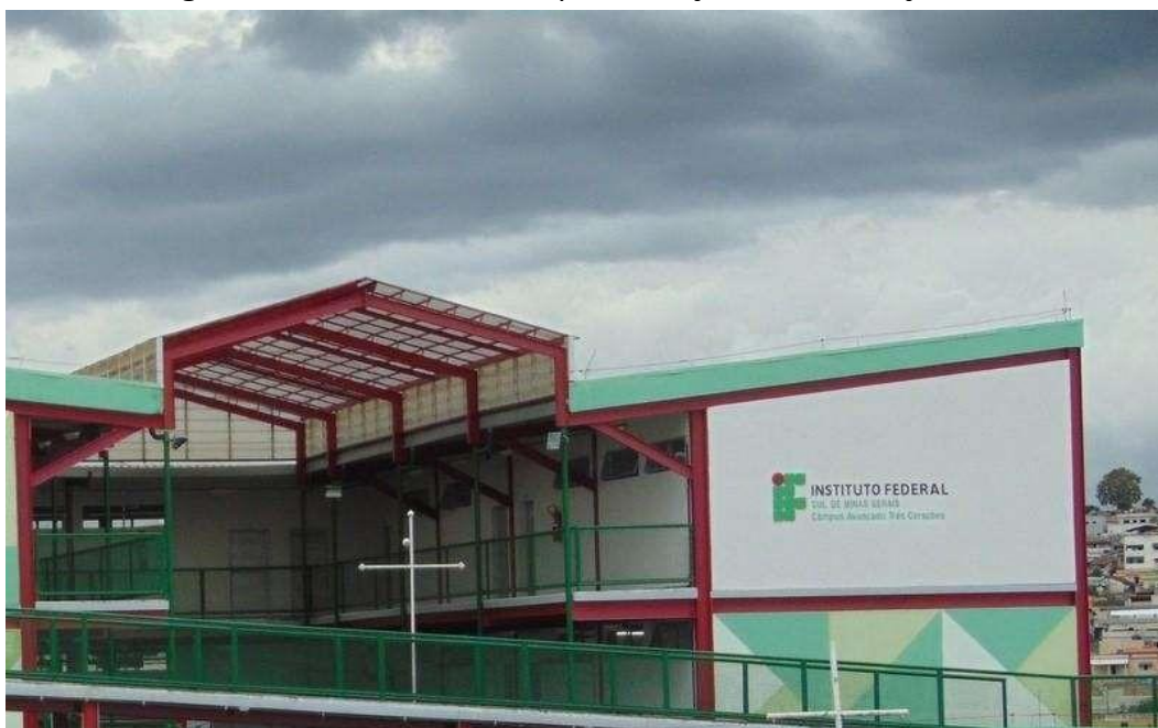
Figura 08 – Fachada do Campus Avançado Três Corações