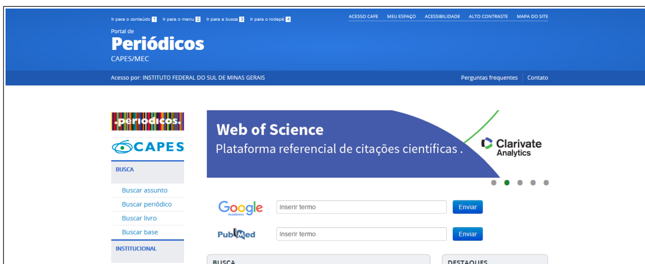
Figura 1: Portal CAPES página inicial

2. Em seguida, clicar na aba: “ACESSO CAFe” (Figura 2).