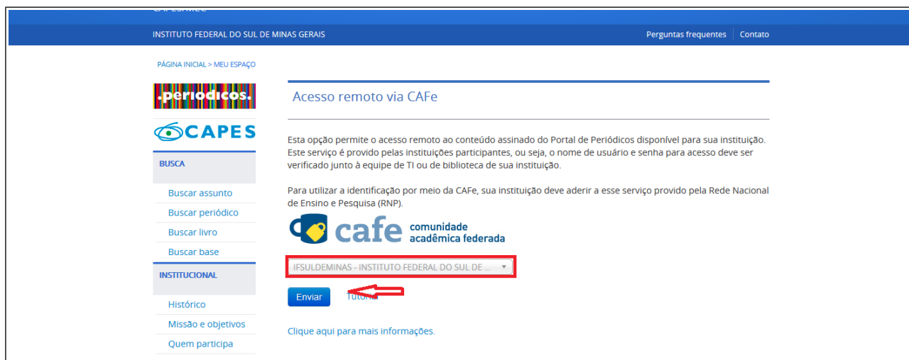
Figura 3: Sistema CAFe Instituição Federada

4. Informar o seu CPF e a senha (a mesma que você usa para acessar o sistema acadêmico). Clicar em “login” (Figura 4).