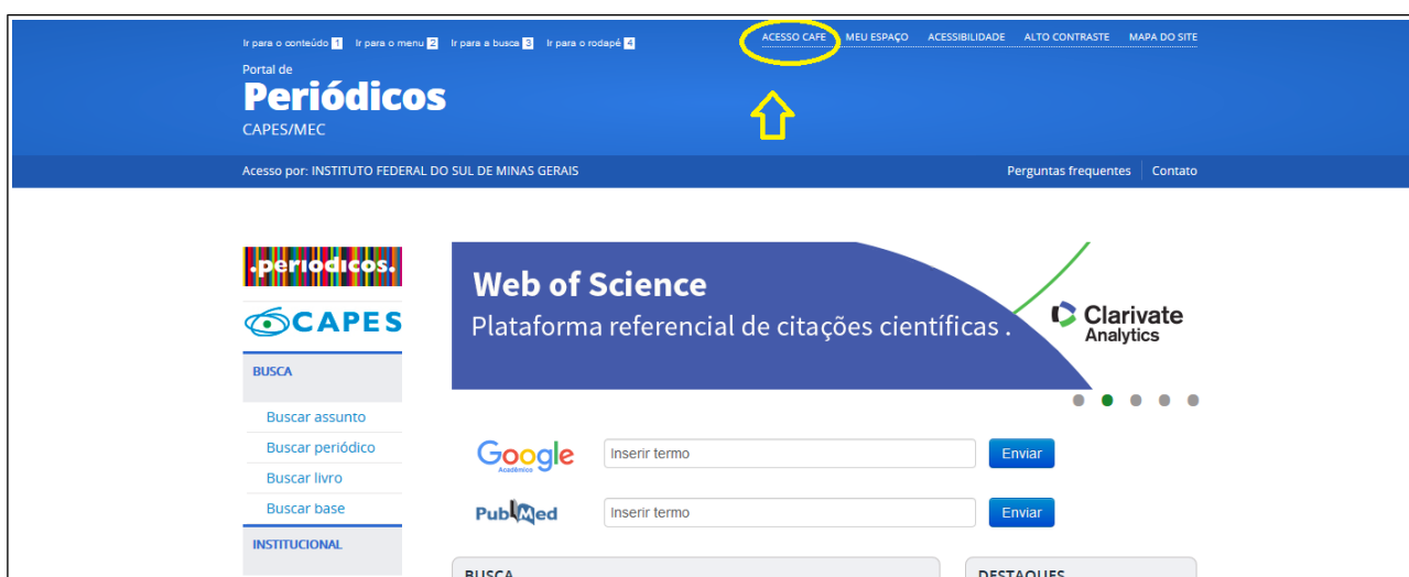
Figura 2: Portal CAPES “ACESSO CAFe”

3. Na próxima tela, junto ao ícone “CAFe”, selecione por meio da barra de rolagem a instituição: IFSULDEMINAS- INSTITUTO FEDERAL DO SUL DE MINAS e clique em enviar (Figura 3).