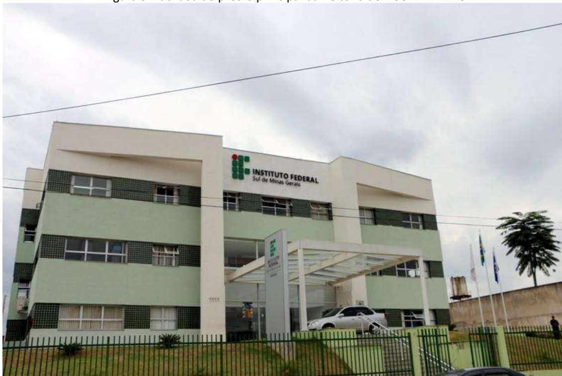
Figura 3: Fachada do prédio principal da Reitoria do IFSULDEMINAS

Inicialmente, a equipe destinada a trabalhar na unidade reunia-se nos campi agrícolas para discutir os trabalhos. A partir de abril de 2009, foi alugado um prédio de três andares no bairro Medicina, de Pouso Alegre, onde a Reitoria passou a funcionar. Com o aumento das demandas e a expansão do IFSULDEMINAS, em 2012, um prédio anexo ao antigo endereço se juntou à estrutura, abrigando setores como Diretoria de Tecnologia da Informação, Diretoria de Ingresso e a Pró-Reitoria de Desenvolvimento Institucional.