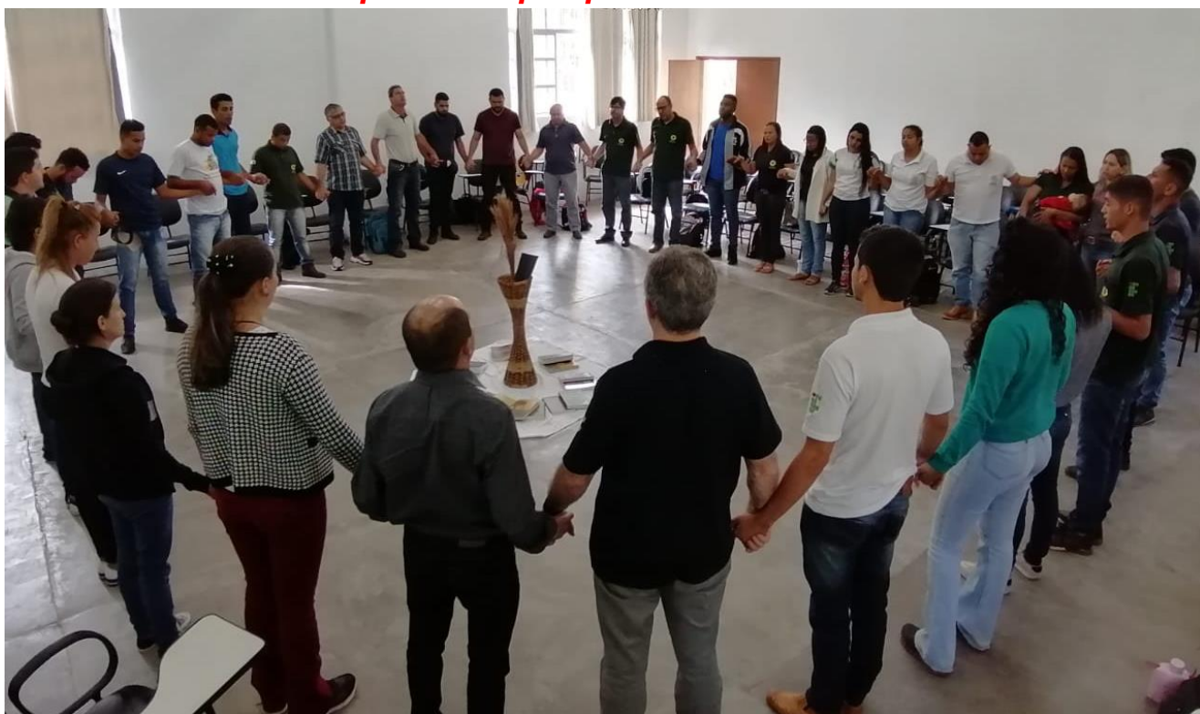
Abertura da X Sessão Escolar, março de 2020